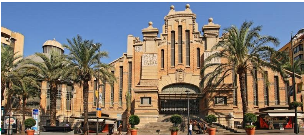
Mercado Central de Alicante

El interior está repleto de puestos de producto fresco y de buena calidad como pescado, marisco, salazones, carnes, frutas y verduras, provenientes del Mediterráneo y de las huertas cercanas. La zona de la Plaza del Mercado, junto a la calle Castaños , son populares por el conocido como « tardeo », que consiste en tomar una cerveza en alguna de sus terrazas para después cenar y terminar la fiesta en bares y pubs cercanos.