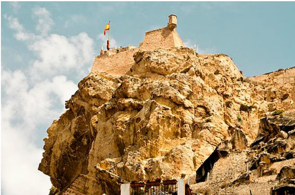
La cara del moro

Como curiosidad, este castillo junto al monte, es apodado «la cara del moro» , ya que si lo observas desde la Playa del Postiguet, su perfil tiene forma de cara.