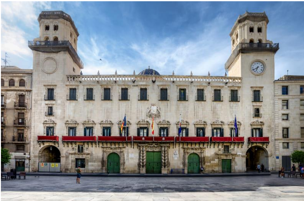
Ayuntamiento de Alicante

Cuando pares a comer por la zona, acércate a “Probar el Buen Bar” , un gran restaurante del centro de Alicante para disfrutar de la gastronomía local.