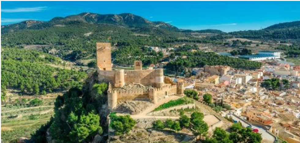
Castillo de Biar

El mayor atractivo turístico de Biar es su castillo. Construido en el siglo XIII, aun conserva una antigua bóveda de estilo almohade. Asimismo, te recomendamos observar algunos restos del antiguo conjunto fortificado, como la Puerta de Játiva o la Puerta de Castilla. También te recomendamos visitar la Iglesia de la Asunción, de estilo gótico tardío del siglo XV, el Convento de los Capuchinos o el Ayuntamiento, de estilo neoclásico.