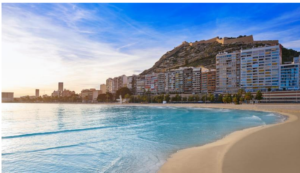
Playa de Postiguet

Otras playas que visitar en Alicante más tranquilas, aunque se encuentran un poco más alejadas del centro, son la Playa de San Juan o las calas del cabo de las Huertas como la Cala Cantalar (perfecta para hacer buceo).