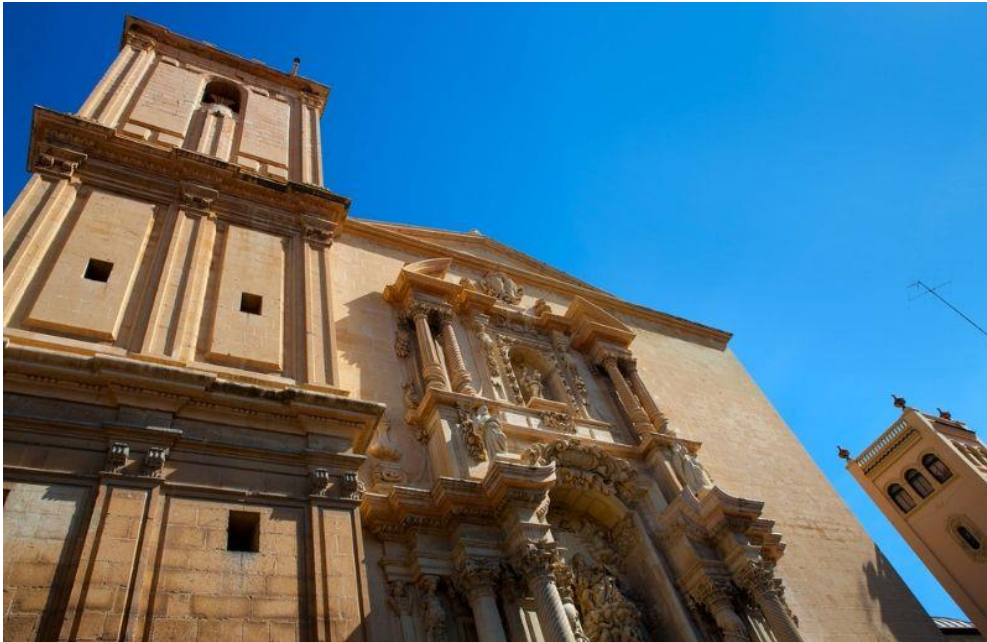
Concatedral de San Nicolás

Después de observar su exterior, puedes recorrer su interior en el que destaca su esbelta cúpula, la capilla barroca de la Comunión, las portadas del claustro y la capilla de San Nicolás, patrono de la ciudad.