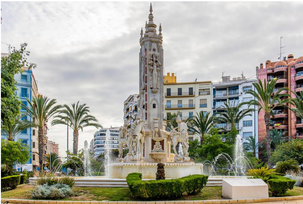
Plaza de Luceros

Desde esta plaza puedes dar un paseo por la Avenida Doctor Gadea, pasando por delante del palacete de la « Casa de las Brujas », un edificio que destaca por su fachada modernista, hasta llegar a al Parque de Canalejas y la Explanada de España.