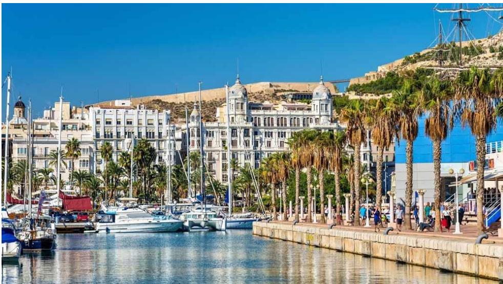
Puerto de Alicante

Merece la pena dar una vuelta por el agradable paseo marítimo por la mañana y al atardecer, para después tomar una copa en alguno de sus bares como el “Noray Café Bar”.