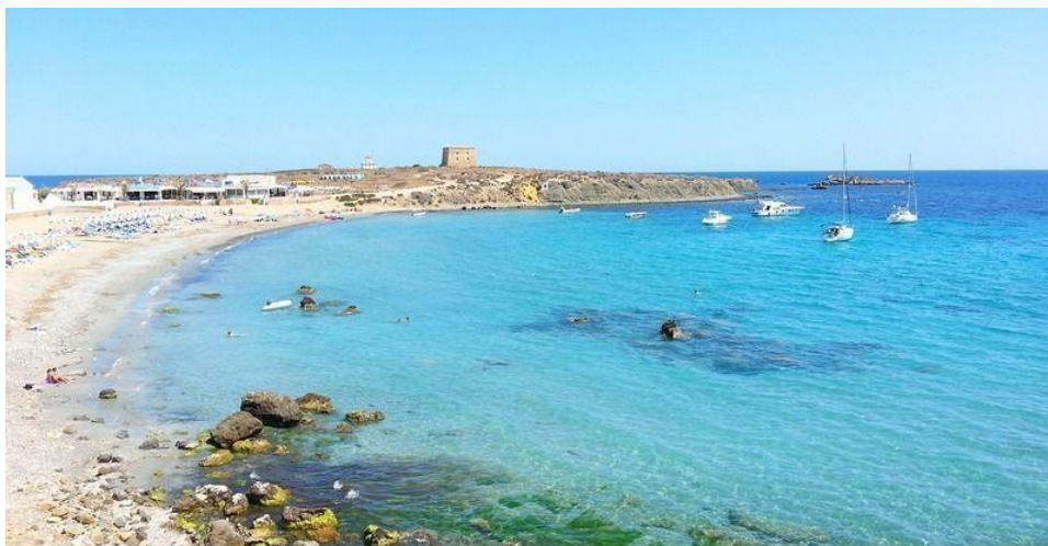
Isla de Tabarca

Para llegar a la isla puedes coger uno de los barcos que salen diariamente del Puerto de Alicante y tardan menos de una hora en llegar. Puedes reservar tus tickets online aquí .