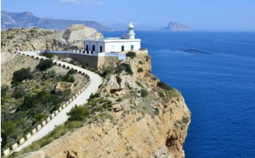
Faro del Albir

Una actividad perfecta para hacer hambre para el siguiente arroz. Puedes aparcar el coche aquí .