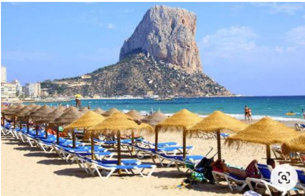
Peñón de Ifach

Otro atractivo de Calpe son sus salinas , unas antiguas explotaciones salineras que se remontan a la época romana y que hoy en día son un humedal protegido donde se pueden observar aves como flamencos, garzas o cigüeñas.