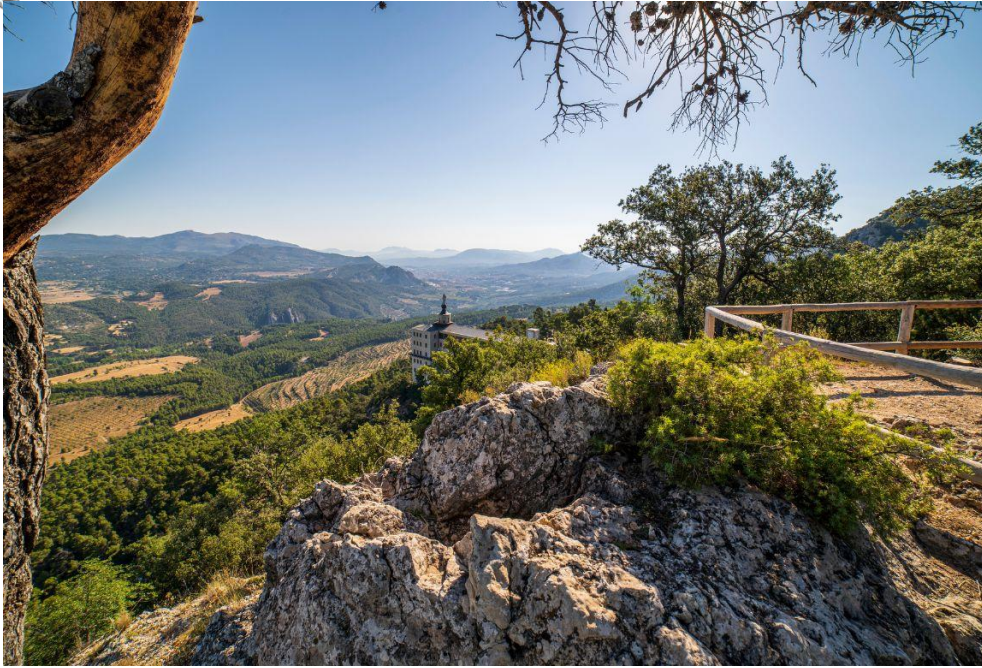
Parque natural de la Font Roja