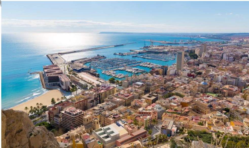
Vistas desde el Castillo de Santa Bárbara