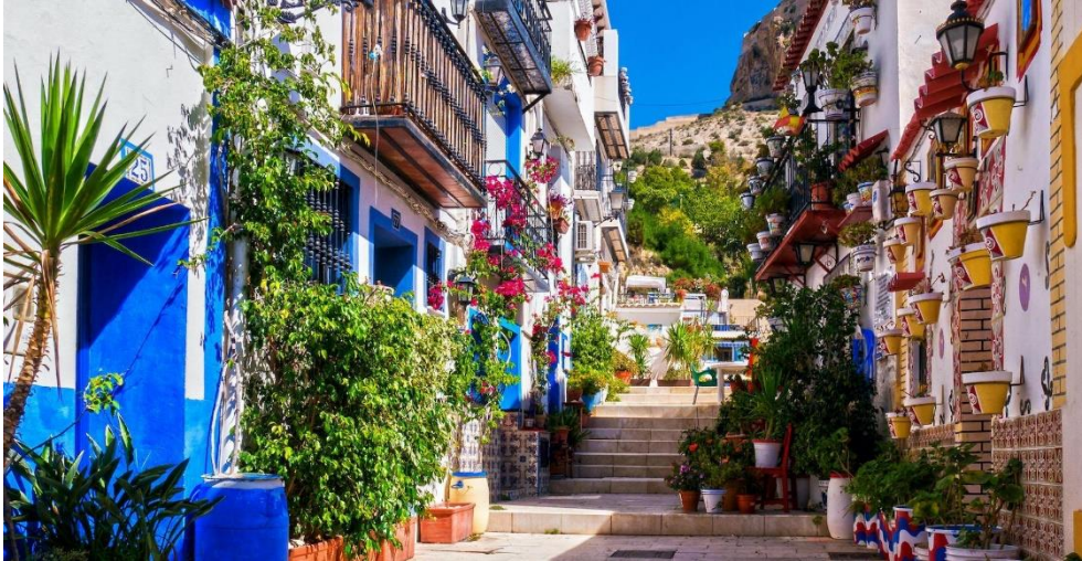
Barrio de Santa Cruz

Esta zona también concentra algunos de los restaurantes más recomendados donde comer en Alicante como son “ La Tasca del Barrio ”, “ Las Brasas de San Miguel ”, “ La Crispeta ”, “ El Gosto del Gourmet ”, “ Cervecería Sento Rambla ” perfectos para hacer una parada ya sea a la hora de comer o cenar y probar alguno de sus platos típicos como los arroces.