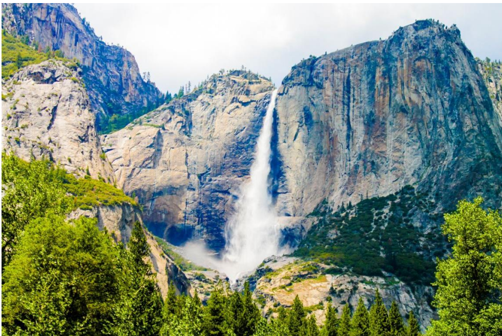
Parque natural de la Serra Mariola

Rodeando Alcoy se encuentra el Parque Natural de la Sierra de Mariola, un paraíso para los senderistas y amantes de la naturaleza. Con una amplia red de senderos, este parque ofrece impresionantes vistas de montañas, fuentes naturales y una rica variedad de flora y fauna. La Cava Gran, un antiguo depósito de nieve, es uno de sus muchos tesoros ocultos. Este espacio natural es ideal para escapadas de un día, picnics y la observación de aves.