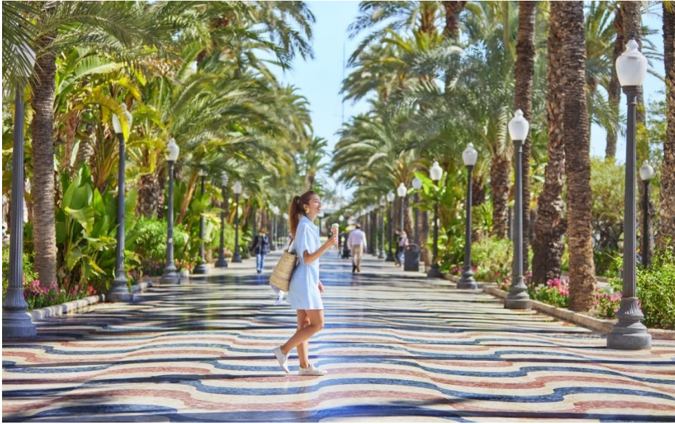
Explanada de España

Mientras paseas por la explanada disfrutarás de artistas callejeros, puestos de artesanías y edificios históricos como la bonita Casa Carbonell, de fachada blanca, hasta llegar a la zona más popular del puerto.