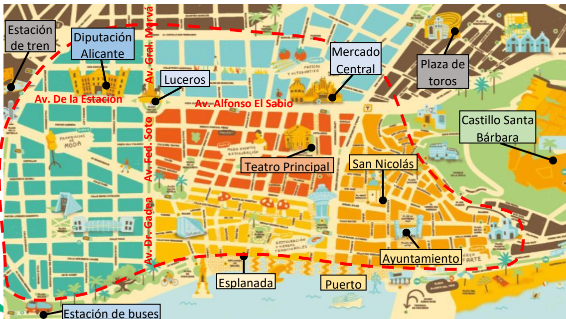
Mapa de la ciudad de Alicante

Aquí abajo, te dejamos un mapa de referencia de donde hospedarse en la ciudad de Alicante (comprendida por la línea discontinua roja). Alicante es una ciudad pequeña y muy manejable a pie. Los buses de la boda saldrán cerca de esta zona (os enviaremos la información de los buses antes de la boda).